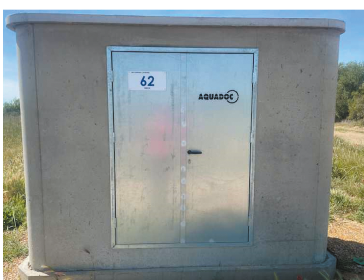
Cabine de livraison : extérieur / intérieur